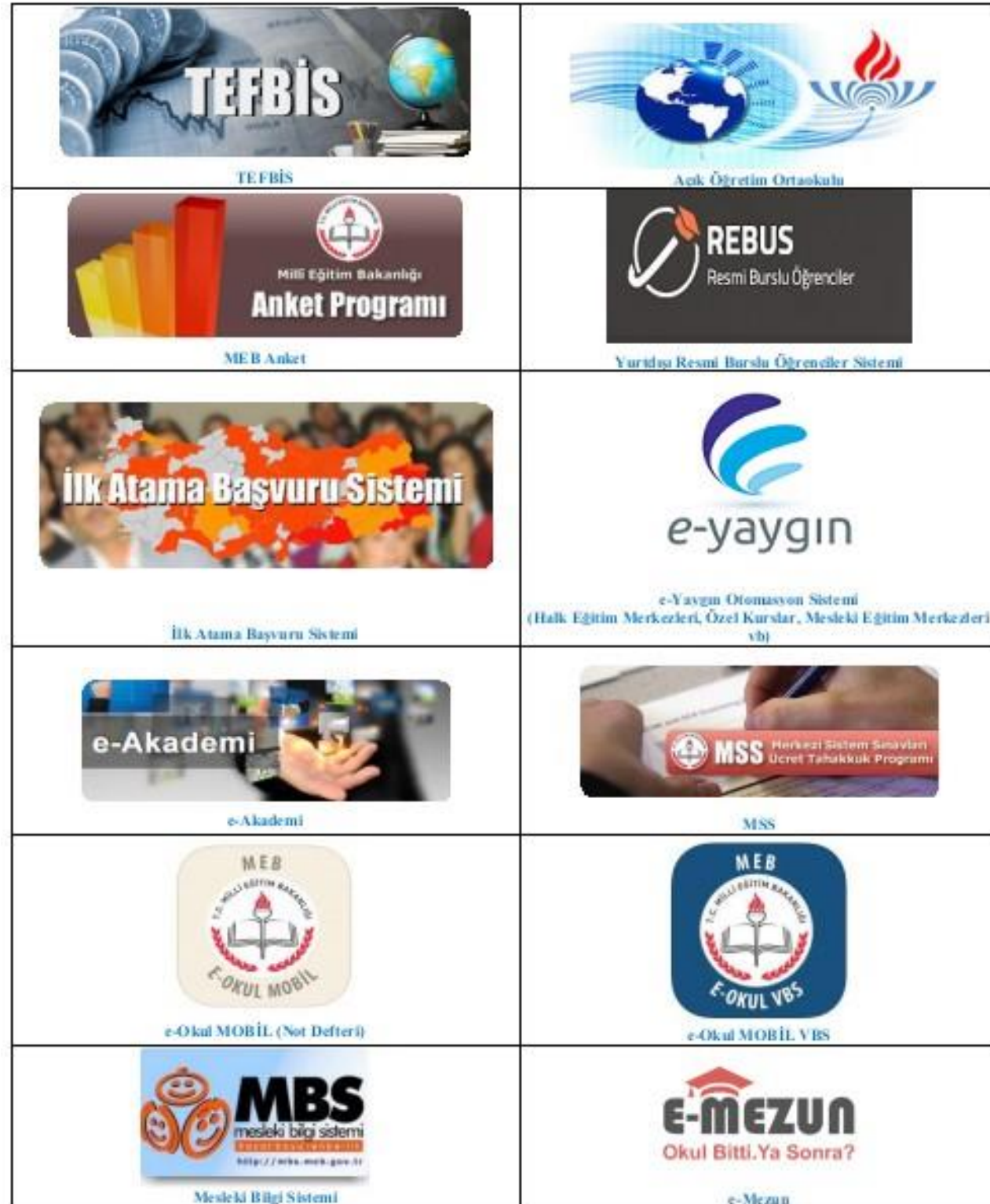
Tablo 1 : Web Tabanlı Çalışmalar